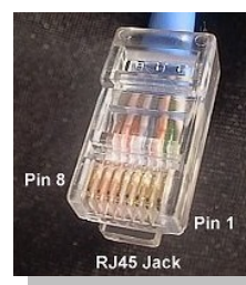
connettore RJ45 visto da davanti