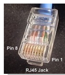
Connettore RJ45 dal davanti